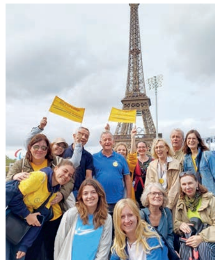
Bénéficiaires, bénévoles et salariés.

Bénéficiaires, bénévoles et salariés, étaient unis par une même volonté enthousiaste d'encourager avec ferveur les équipes de cécifoot qui se disputaient les quarts de finale. Un mélange de passion, d'émotion et de respect qui a marqué de son empreinte tous les participants.