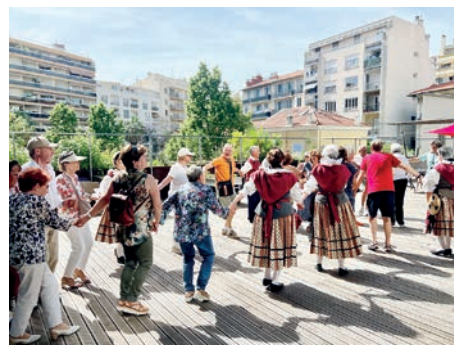
Animations sur la terrasse de l'Institut.

L'Institut Claude Pompidou, un espace original pour tenter de mieux vivre la maladie d'Alzheimer, qui a su acquérir une identité, mais aussi une âme au fil des ans. Une dynamique précieuse à préserver.