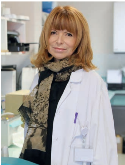
Professeure Véronique Paquis-Flucklinger, lauréate du Prix Claude Pompidou 2024.

Une équipe de l'IRCAN (Institute for Research on Cancer and Aging, Nice) lauréate 2024 pour ses travaux sur la sclérose latérale amyotrophique et la démence fronto-temporale.